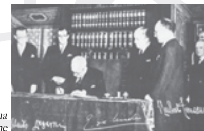
La firma della Costituzione