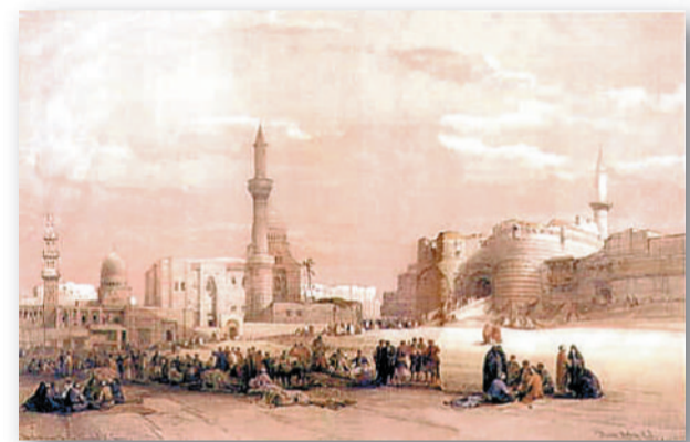
Asinistra: David Roberts, Piramidi di Giza dal Nilo, litografia sec. XIX Al centro: David Roberts, Danzatrice arabe al Cairo, litografia sec. XIX Qui sopra: David Roberts, Ingresso della città del Cairo, litografia sec. XIX