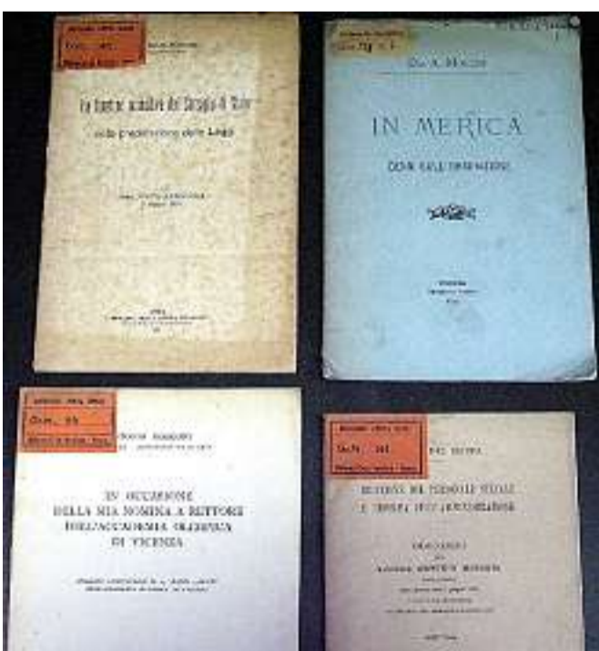
Opere di Mosconi conservate in Bertoliana. Nell'autobiografia "La mia linea politica" Mosconi racconta la sua esperienza di ministro

Assunto al grado di prefetto nel 1911, due anni dopo Mosconi ricevette la nomina a consigliere di Stato, carica che ricoprì cercando di ispirare sempre la sua azione a una rigorosa fedeltà alle istituzioni e a una piena autonomia da condizionamenti di parte. Le sue qualità spinsero le autorità italiane ad affidargli un delicato compito nel 1919, quando fu incaricato dell'amministrazione delle terre della Venezia Giulia, annesse con la guerra appena conclusa. Ma la manifestazione più tangibile della considerazione di cui godeva si ebbe nell'ottobre dell'anno seguente, con la designazione a senatore del Regno, proposta da Giovanni Giolitti, allora Presidente del Consiglio. Tornato a Roma nel 1922, a Palazzo Madama Mosconi cominciò a segnalarsi per la notevole preparazione in ambito economico - finanziario, fino a giungere, nel luglio 1928, a un ruolo tanto prestigioso quanto inaspettato: quello di ministro delle Finanze. Nell'autobiografia "La mia linea politica" egli narra di aver beneficiato, in un primo momento, del sostegno di Mussolini, che lo garantì anche da tentativi di ingerenza di altri ministri. In un tale favorevole contesto il programma da lui intrapreso permise il varo di nuove leggi in materia di evasione fiscale e finanza locale, nonché di misure per il controllo della spesa pubblica e la riduzione degli organici statali. I buoni rapporti con il Duce, tuttavia, cominciarono a peg-