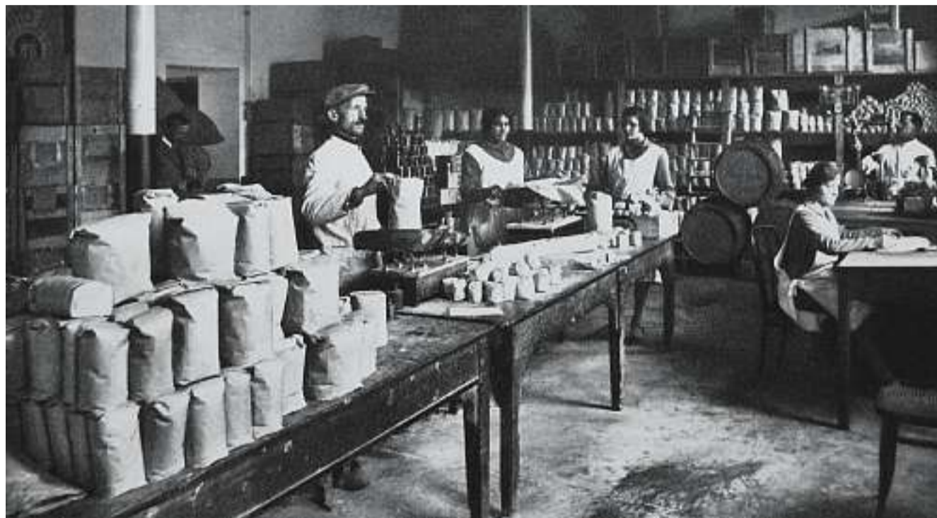
Nel 1873 la società di Mutuo Soccorso a Schio creò i Magazzini cooperativi per la vendita di generi alimentari