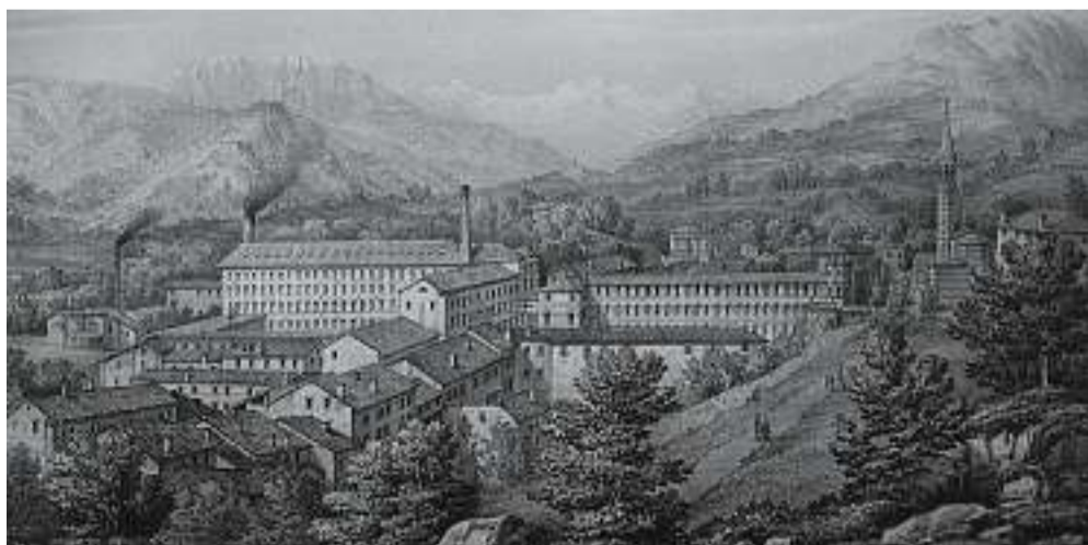
Panorama della Fabbbrica Alta di Schio. Litografia di Carlo Matscheg del 1864