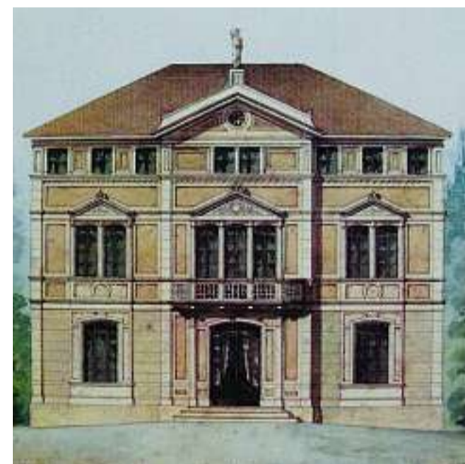
Uno dei quattro modelli di casa costruite a Schio tra il 1873 e il 1890 destinate ad accogliere operai e capi-operai della fabbrica Rossi. Costavano dalle 2.000 alle 10.000 lire